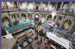
FIL Minería Del 22 de febrero al 5 de marzo