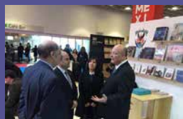
FIL de la Universidad Autónoma de Sinaloa Del 9 al 15 de marzo