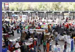
Gran Remate de Libros del Auditorio Nacional Del 23 de marzo al 3 de abril