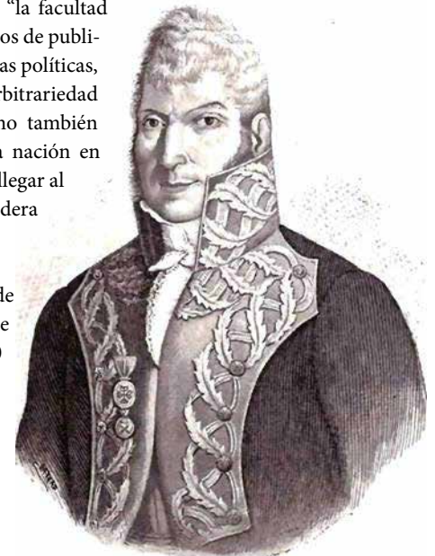
Virrey Francisco Javier Venegas

Sin embargo, justo es destacar la gran importancia que tuvo el periodismo independiente durante el corto tiempo en que gozó de libertad. Actuó como una fuerza que dañó desde dentro las estructuras ideológicas del sistema colonial. Dos días después de que se decretó la libertad de imprenta, Bustamante, desde el Diario de México, saludó a sus compatriotas con estas palabras: “ahora sí que el soberano rompió las negras cadenas del despotismo y arbitrariedad, y dejó la América de ser juguete de los tiranuelos... pues